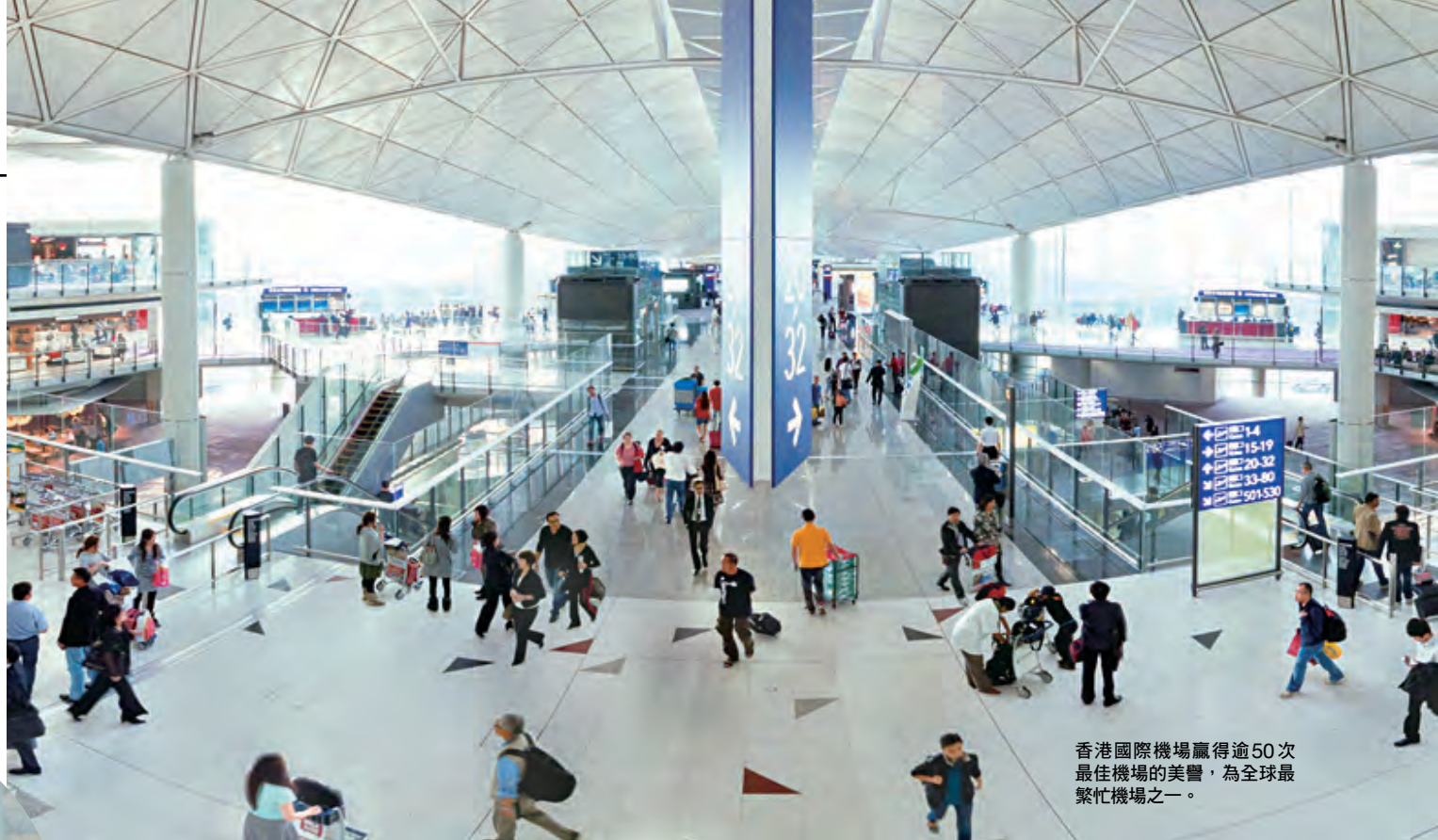
香港國際機場贏得逾50次最佳機場的美譽，為全球最繁忙機場之一。

根據香港物流發展局、香港航運發展局，以及香港港口發展局共同發布的《香港—物流樞紐、華南大門、航運中心》報告指出，供應鏈內的資訊聯