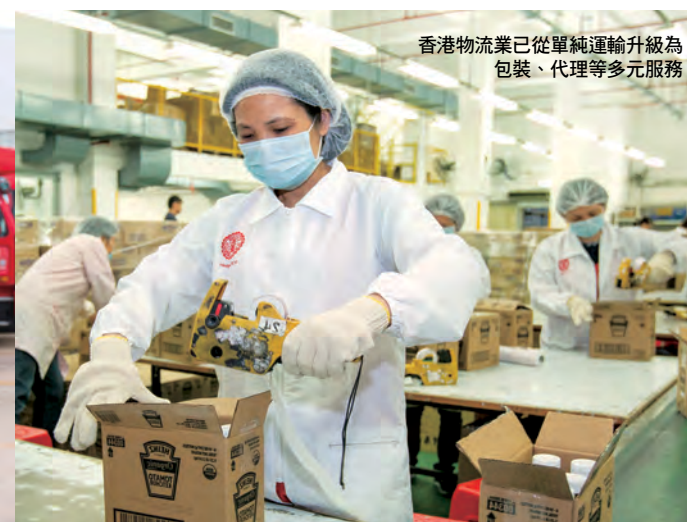
香港物流業已從單純運輸升級為 包裝、代理等多元服務