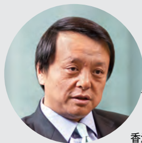
李小加 香港交易所集團行政總裁

第一，香港實行披露為本的上市機制，上市審批制度清晰透明，無輔導期。第二，上市進程快捷，公司從遞交上市申請，到首次收到意見回函平均僅需9天。第三，香港是國際金融中心，資金流動性十分充裕，金融產品豐富，上市公司再融資也非常方便。第四，香港是上市公司邁向國際的跳板，海外投資者雲集，在香港上市可以幫助上市公司擴大國際知名度，而隨著「滬港通」的推出，香