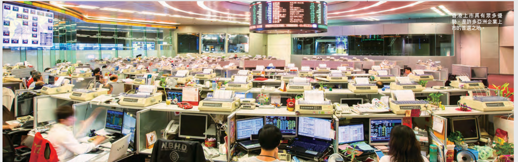
香港上市具有眾多優勢，是許多亞洲企業上市的首選之地。

港上市公司今後還能得到中國大陸投資者的青睞。因此，對很多企業而言，在香港上市十分具有價值。特別對於台灣企業而言，赴港上市可更加接近中國大陸的消費者和投資者，提升在中國大陸市場的影響力。